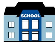
scuole e università