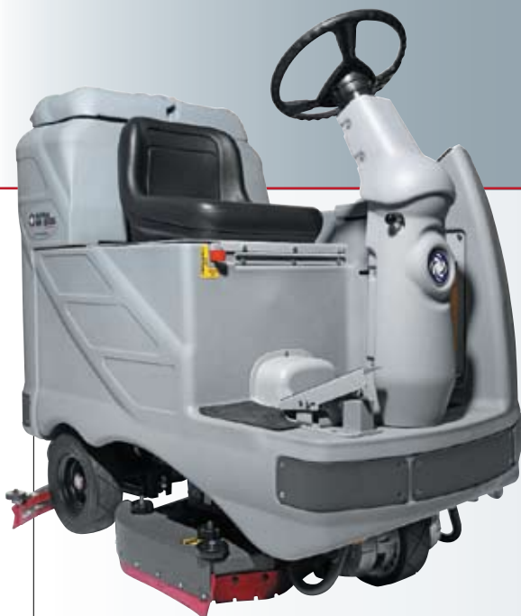
Nilfisk BR 850S

Pulire in modo veloce ed efficiente in condizioni difficili è la caratteristica della serie BR 850S. Ideale per la pulizia in ambienti industriali, magazzini, aree di carico/scarico merci, ma anche in ambienti commerciali quali grandi magazzini e aeroporti, la serie BR 850 assicura una elevata produttività ed efficienza. La serie BR 850S è disponibile in sei differenti testate che si caratterizzano per una pista, reale, di pulizia di 810, 890 e 970 mm con spazzole a disco e cilindriche. Le diverse testate sono intercambiabili tra loro in modo veloce e senza l'uso di attrezzi. L'ampia gamma di spazzole ed accessori permette l'utilizzo della macchina in ogni tipo di applicazione. Questo tipo di flessibilità e di attenzione per i particolari rende i prodotti Nilfisk la migliore soluzione alle Vostre esigenze di pulizia.